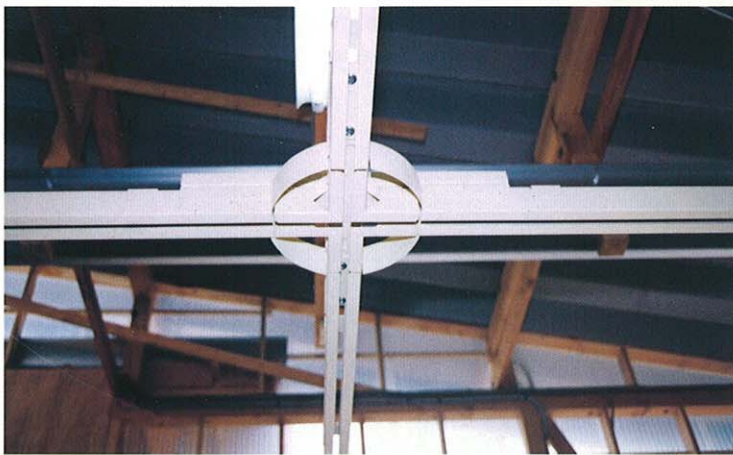
ロータリー式ジャンクション(実用新案出願中)