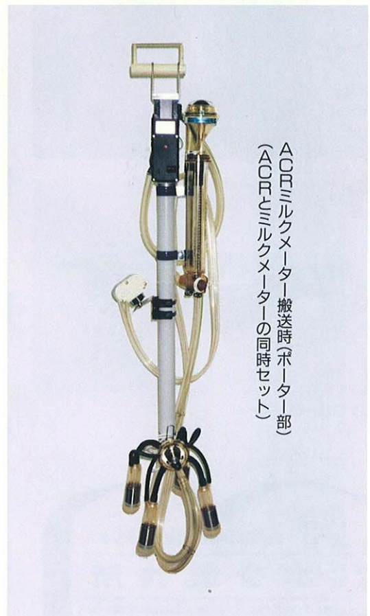
ACRミルクメーター搬送時(ポーター部) (ACRとミルクメーターの同時セット)